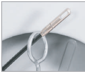
FIBRA DE VIDRIO